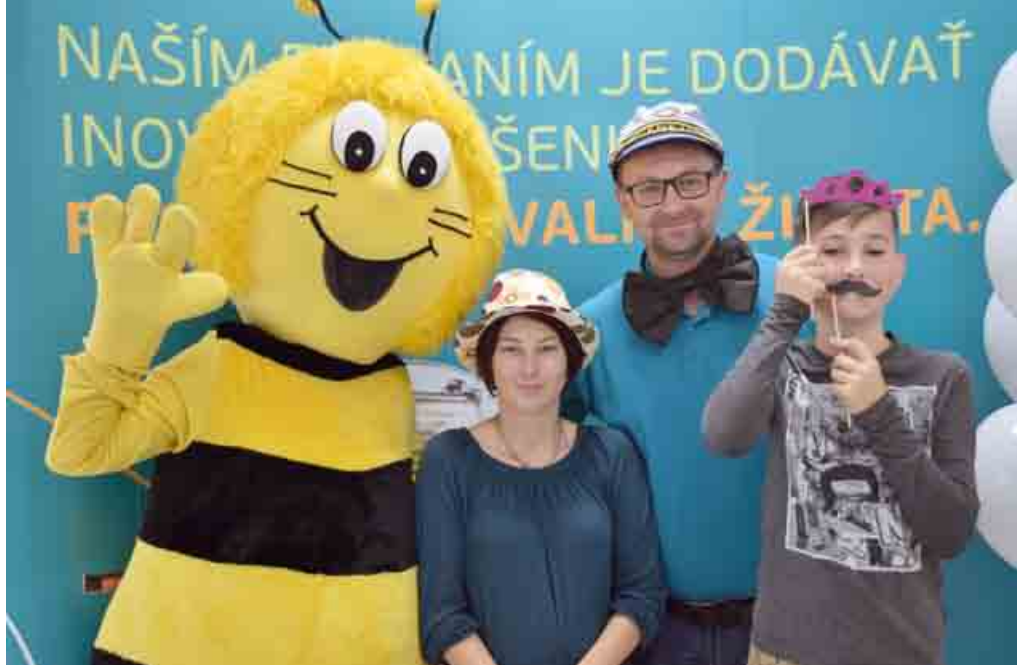
Zamestnanci spišskonovoveského výrobcu chladiarenských kompresorov si spolu so svojimi rodinami užili deň plný zdravia, oddychu a zábavy.