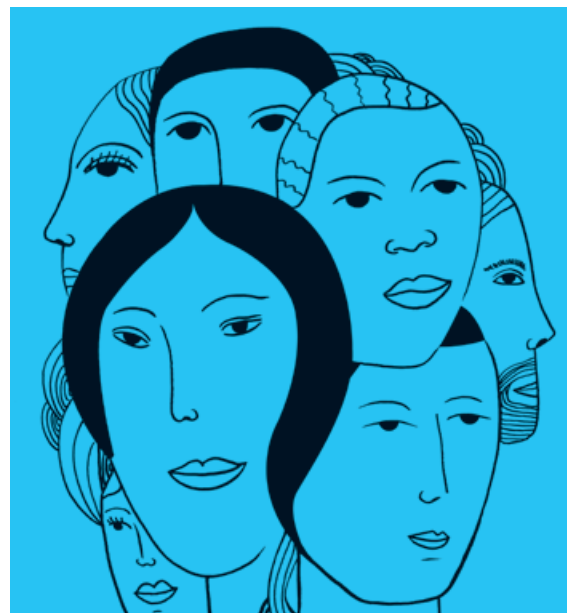
Stavebníci zo Skanska aktualizovali svoje etické pravidlá a princípy.

O mesiac neskôr, 1. októbra, vstúpil do platnosti aj Dodávateľský kódex Skanska , ktorý hovorí o tom, aké správanie spoločnosť očakáva nielen od svojich zamestnancov, ale aj partnerov a dodávateľov, ktorí sú neoddeliteľnou súčasťou podnikania firmy a jej stratégie konať eticky a transparentne. «