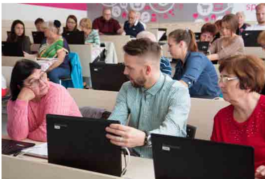
Dobrovoľníci zo spoločnosti T-Systems Slovakia budú do decembra učiť seniorov, ako môžu využívať moderné komunikačné technológie.

Keď dreli školské lavice oni, nestáli na nich ešte žiadne počítače, klávesnice ani myšky. To im ale vôbec neprekáža. To, čo sa za mladi naučiť