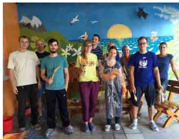
Zamestnanci zo spoločnosti EY sa do dobrovoľníckeho EY Community Day zapojili už deviaty rok.

Spoločnosť EY zapája už deviaty rok svojich zamestnancov do dobrovoľníctva a pomoci blízkym komunitám. Na tradičnom dobrovoľníckom podujatí EY Community Day, ktoré sa konalo 14. septembra, 107 dobrovoľníkov venovalo svoj čas 9 neziskovým organizáciám. Za jeden deň vyčistili z člnov niekoľko kilometrov Malého Dunaja, vyvenčili psíkov a upravili areál útulku, namaľovali detské ihrisko, sprevádzali ťažko zdravotne postihnutých klientov na výlete v ZOO, spriechodňovali Kochovu záhradu, pomáhali v záhrade komunitného centra, v krízovom stredisku, v dome pre týrané ženy a maľovali tiež priestory nízkoprahového centra.