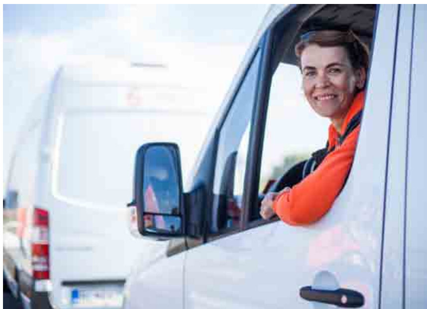
Kuriérskej spoločnosti TNT záleží na tom, aby jej vodiči boli expresnými šófermi, no aby zároveň dbali o svoje zdravie, bezpečnosť na ceste a kvalitu ovzdušia.