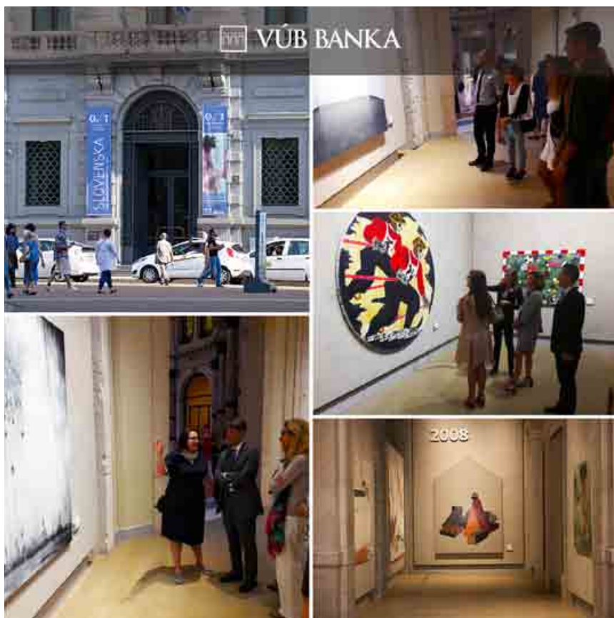
Návštevníci milánskej Gallerie d'Italia si prehliadku výtvarných diel mohli pozrieť v dňoch od 9. septembra do 23. októbra.

Slovensko môže takýmto pritažlivým spôsobom v rámci programu slovenského predsedníctva EÚ reprezentovať našu krajinu v zahraničí vzorkou toho najlepšieho zo súčasného mladého slovenského umenia. «