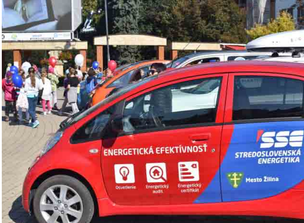
Stredoslovenská energetika počas ETM podporila eMobility day Žilina 2016.

V spoločnosti Stredoslovenská energetika bol 20. september vyhlásený za „DEŇ UDRŽATEĽNEJ MOBILITY“. Kto prišiel v tento deň do práce inak ako autom – na bicykli, autobusom, na korčuliach alebo kolobežke – mal možnosť pristaviť sa a občerstviť zdravými smoothie raňajkami. Pre zamestnancov bola tiež pripravená prednáška na tému „Cyklodoprava a nové cyklotrasy v našom meste“, a to v spolupráci s mestom Žilina. V piatok 23. septembra sa na Hlinkovom námestí uskutočnila akcia eMobility day Žilina 2016. Podujatie organizovalo mesto Žilina v spolupráci s garantom Tesla