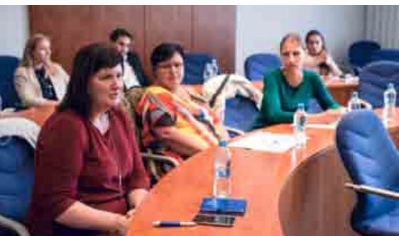
Úvodné stretnutie advokátov a neziskových organizácií na Právnickej fakulte Univerzity Komenského.

V budúcnosti by sme radi tento druh pomoci posilnili a prostredníctvom komentárov od študentov a advokátov pro bono pomoc otvorili aj iným organizáciám. «