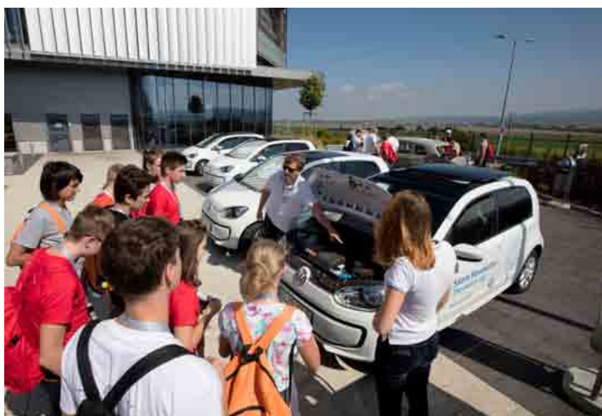
Žiaci základných škôl sa počas Automobilovej Junior Akadémie zoznámili s elektrickým autom z dielne Volkswagenu.

Bratislavský závod Volkswagen Slovakia (VW SK) privítal v rámci 1. ročníka Automobilovej Junior Akadémie (AJA) približne 90 žiakov základných škôl. Výrobu vozidiel im automobilka priblížila v spolupráci so Strojníckou fakultou Slovenskej technickej univerzity v Bratislave (SjF STU).